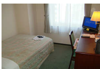
市原マリンH シングル